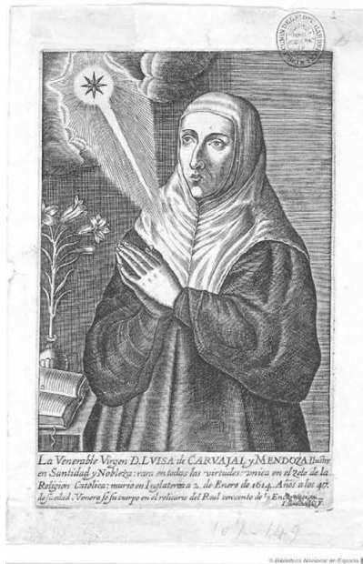
Fig. 1. Juan de Courbes: Retrato de Luisa de Carvajal y de Mendoza (1623).

Alcanzó los cuatro votos, pobreza, obediencia, perfección y martirio, entre 1593 y 1598. Sin embargo, no quiso renunciar a su herencia, incluso llegó a los tribunales para reclamarla, pero con el único ánimo de convertirla en obras caritativas. Tras la ejecución en Inglaterra del jesuita inglés Henry Walpole, decidió dedicar su fortuna a la creación y mantenimiento del Colegio Inglés de Jesuitas en Lovaina.