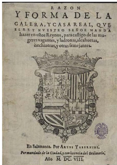
Fig. 3. Razón y Forma de la Galera.

perdemos todo el caldo de cultivo que, en torno a esa producción singular, florecía y avivaba ciertas perspectivas por encima de otras. Es como explicar un terremoto sin entender el movimiento tectónico, o calcular el desastre a partir de la escala Richter sin atender a las condiciones arquitectónicas y sociales del territorio afectado. La producción de Magdalena de San Jerónimo debe entenderse como la confluencia tectónica de símbolos, tradiciones, relaciones de género y políticas propias de una época; sus cartas y sus escritos deben situarse en la encrucijada de otros muchos textos, con la excepcionalidad de constituir, tal vez, la primera inflexión inteligible de un largo proceso: el de la historia de la reclusión como castigo. No es ni el principio ni el final de nada, es solo una parada obligada. Otras muchas habían escrito con anterioridad, también hubo experiencias anteriores de encierro que ya hemos mencionado y había incluso una noción de república que mudaba, y una de Estado que iba adquiriendo forma. Todo esto, tal vez, pudo convertir el tratadillo Razón y forma... , en uno de los fundamentos castellanos que la historia contempla para la cárcel moderna. Moderna, en todos los sentidos.