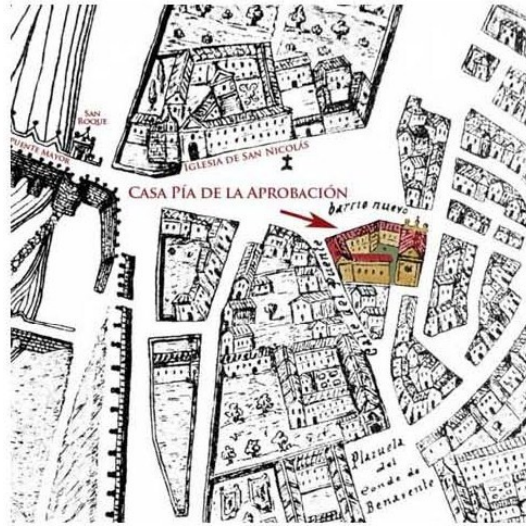
Fig. 2. Casa Pía de la Aprobación.