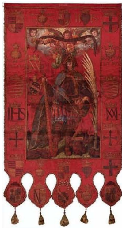
Fig. 5. Estandarte de San Mauricio.

vestido de pontifical; yba la Ciudad y el duque de Lerma, como regidor della, detrás, con cirios blancos. En la Plaça de Palacio, debajo de las ventanas donde sus magestades estaban, se hizo un rico altar con tres gradas, lleno de reliquias del oratorio de la reyna, nuestra señora, con una gran valla, dentro de la qual estaban dos bufetes cubiertos con paños de brocado, sobre los quales se pusieron las urnas de los dos santos, y allí cantaron los cantores de la capilla real dos motetes. Tocaronse las chirimías y otros instrumentos y de allí prosiguió la procesión. (Diego de Guzmán 1617).