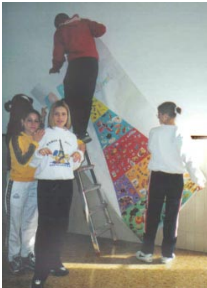
Instal·lació del plafó amb la piràmide dels aliments.

La confecció del plafó s'ha dividit en grups d'alumnes: uns han dissenyat, mesurat i retallat els diferents ele-